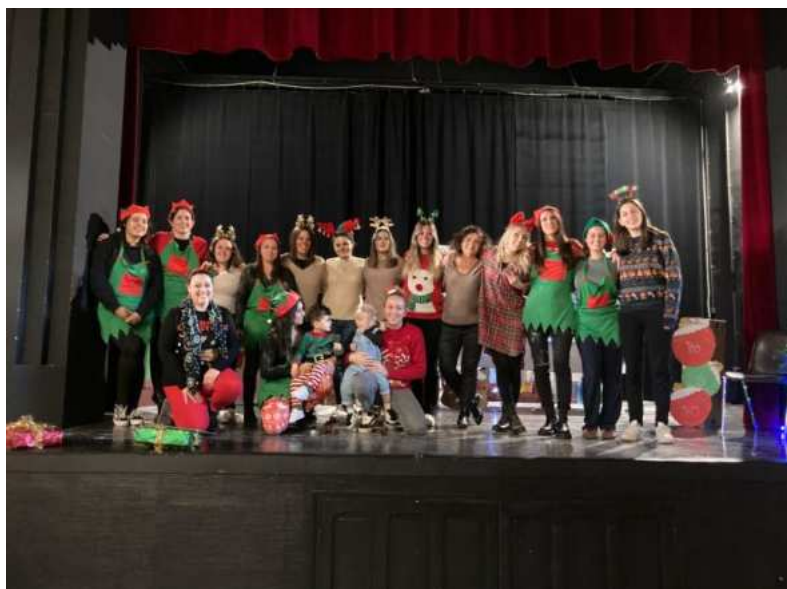
Une équipe investit !