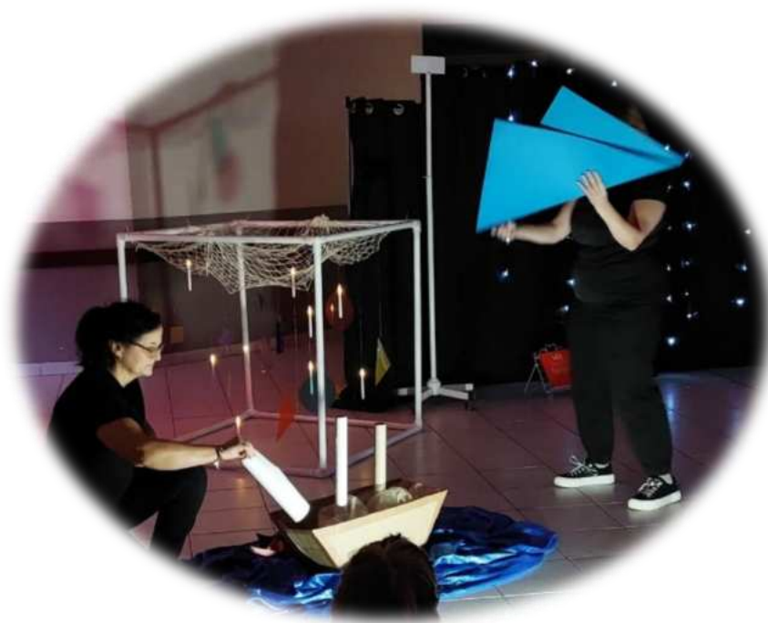
Spectacle de Noël adaptation du livre « les petits papiers » par l'équipe du RPE